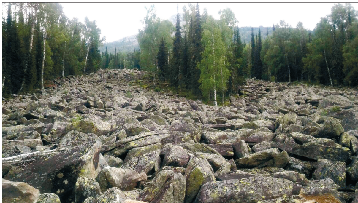
Рис. 1. Курумник. Основные проводники горения отсутствуют. Распространение пламенного горения исключено.