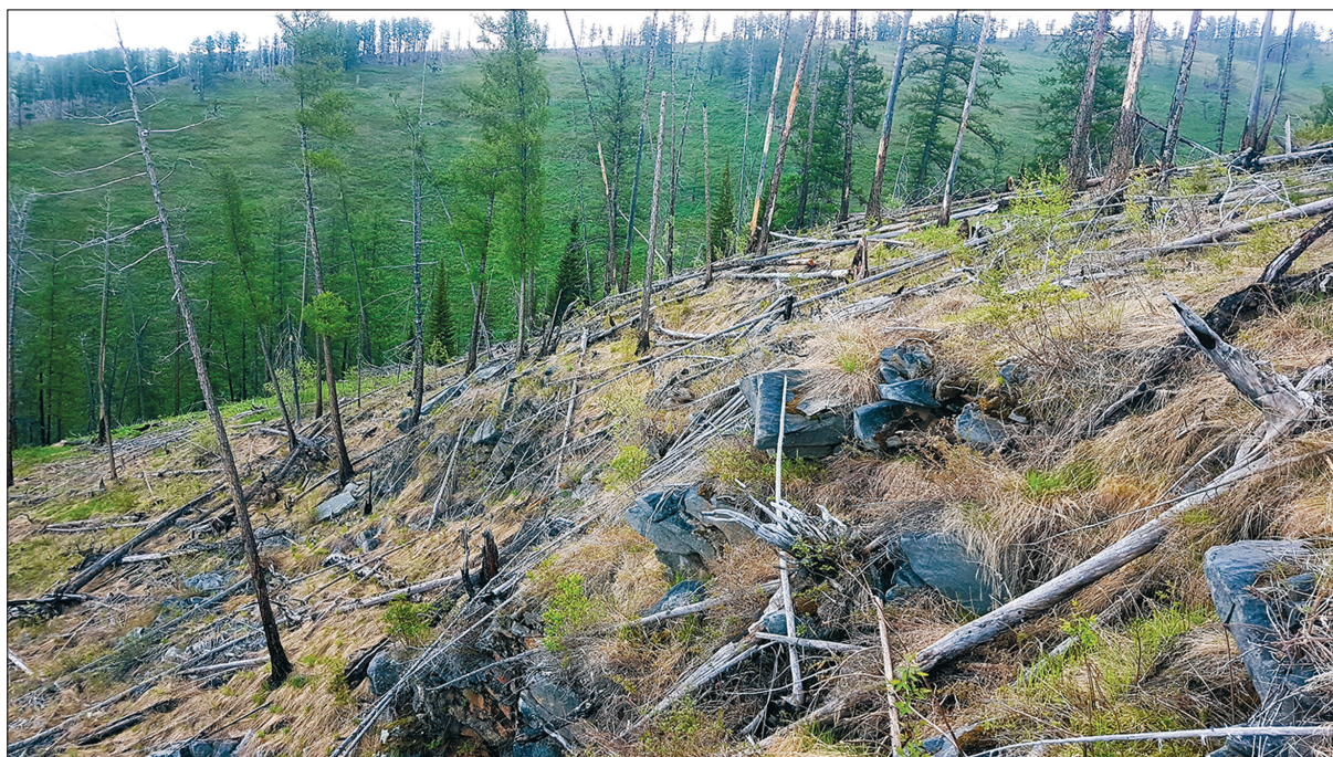
Рис. 2. Каменистая россыпь, поросшая злаками. Пожароопасна весной и сухой осенью уже при I классе засухи по условиям погоды из-за травяно-ветошного типа основного проводника горения.

вает, а частично оставшаяся уплотняется и может проводить только беспламенное горение – тление с невысокой скоростью. Такие участки летом характеризуются беспроводниковым типом ОПГ – Бп1.