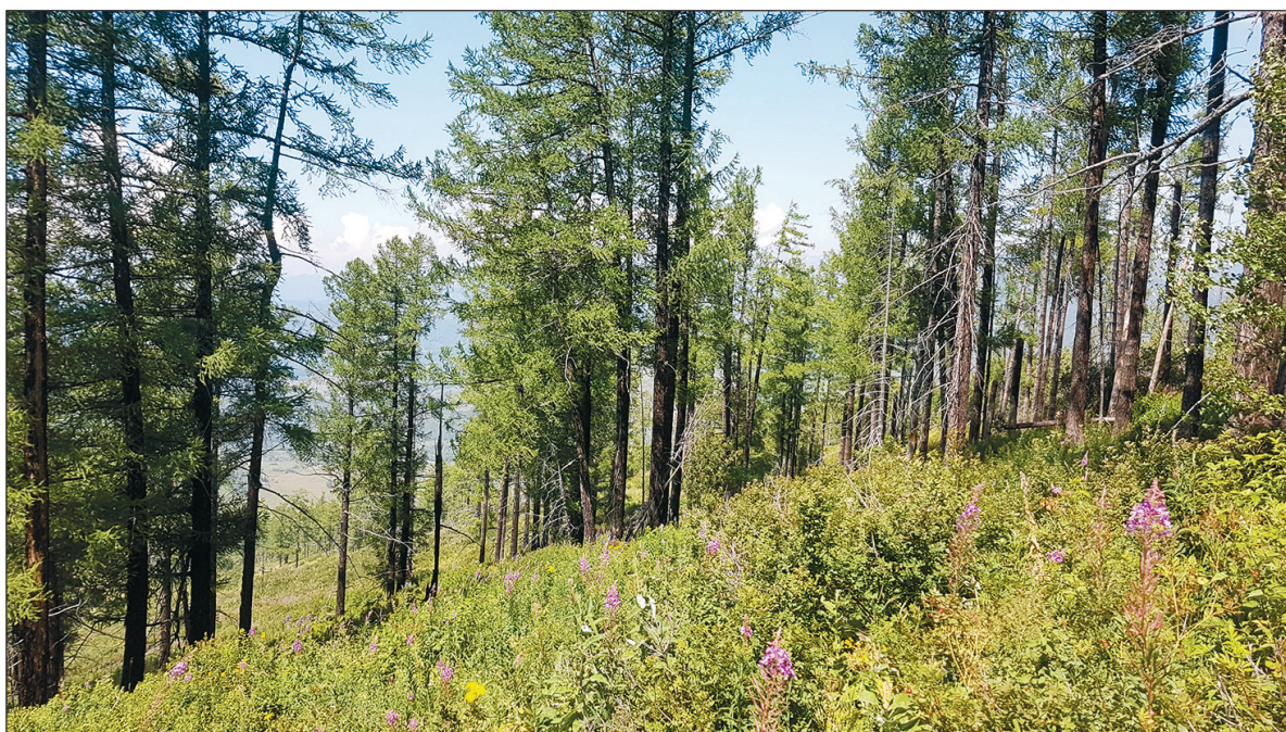
Рис. 3. Лиственничник травяной. Негоримый в летнее время.