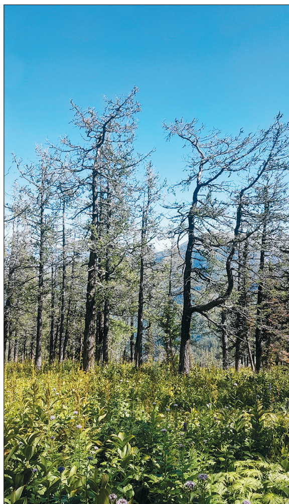
Рис. 4. Лиственничник высокотравный. Негоримый в летнее время.

ного горения уже при I классе засухи по условиям погоды, чему будут способствовать горные условия и ветер. Летом пожароопасность территории значительно снижена. При III классе засухи по условиям погоды в стадии пожарного созревания находятся только отдельные участки, а большая часть территории негорима. При сильной засухе (при V классе засухи и выше) распространение пламенного горения возможно на отдельных участках с плотноопадным типом ОПГ, а беспламенного (тления) – на большей части территории с беспроводниковым типом ОПГ (Бп1), где под травяным покровом присутствует подсыхающая подстилка.